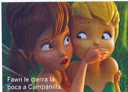
Fawn le cierra la boca a Campanilla.